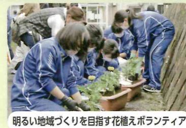
明るい地域づくりを目指す花植えボランティア