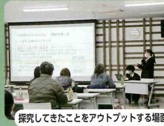
探究してきたことをアウトプットする場面