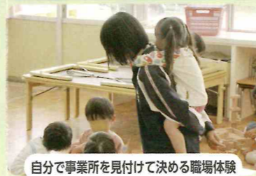
自分で事業所を見つけて決める職場体験