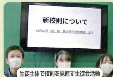
生徒主体で校則を見直す生徒会活動