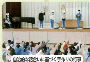
自治的な話合いに基づく手作りの行事