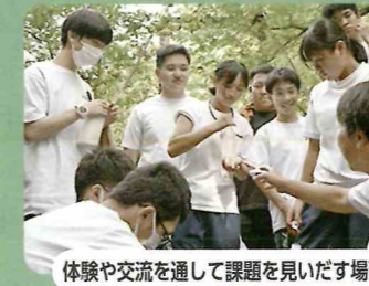
体験や交流を通して課題を見いだす場面