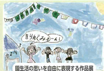
園生活の思いを自由に表現する作品展