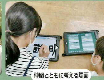
仲間とともに考える場面