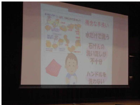
パワーポイントを見ながら、これからの生活について理解を深めました。