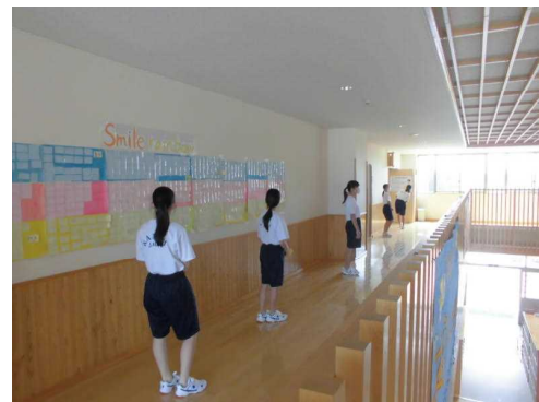
身体測定時に、新しい生活様式を実践！