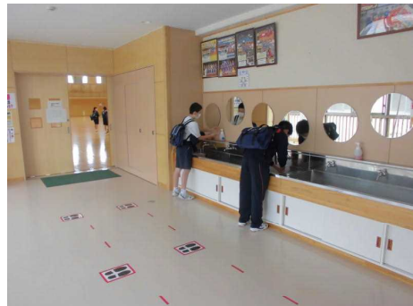
手洗いをして、教室に入ります。