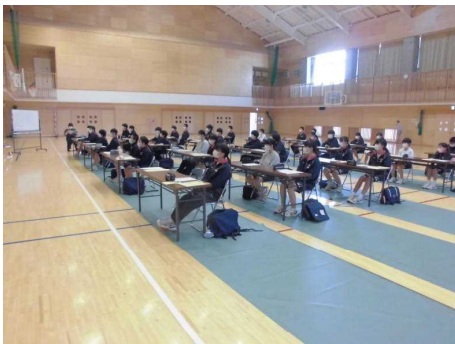
パワーポイントを真剣に見て理解！