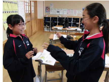
① 1組 道徳授業場面。今回は、「 礼儀の心 」について学びました。これは不特定な相手との体験活動の場面です。この後、さまざまな意見交流を図りました。