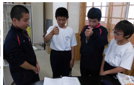
④ 4組 理科『実験1-A 光合成で二酸化炭素が使われることを確かめよう。』に取り組む生徒たちの授業風景。試験管に入れた 石灰水 が、 白く濁るかどうか を確かめています。