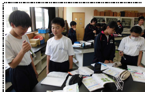
② 2組 理科『実験1-B 光合成で二酸化炭素が使われることを確かめよう。』に取り組む生徒たちの授業風景。試験管に入れた B.T.B液 の色の変化を確かめています。