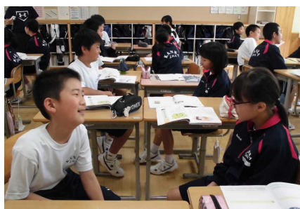
③ 3組 道徳授業場面。今回は、「 礼儀の心 」について学びました。これは二人組でのあいさつ体験の場面です。この後、さまざまな意見交流を図りました。